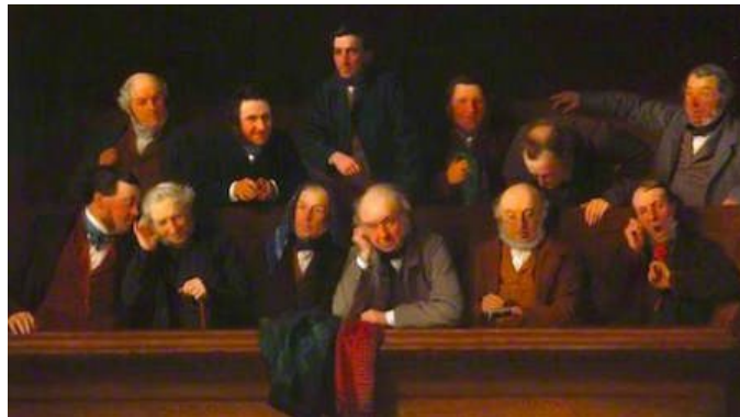
La panda evaluando tu música

Si no hay reacciones buenas, lo mejor será rehacer el tema o pasar a otro tema y así te ahorrarás frustraciones y no perderás tiempo. En verdad lo ganarás, porque habrás aprendido, y tu próximo tema seguramente será mejor.